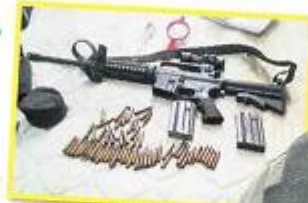
LA POLICÍA MOSTRÓ EL ARMA DE GUERRA.