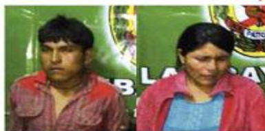
Individuos quedaron en calidad de detenidos.