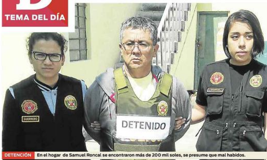
DETENCIÓN En el hogar de Samuel Roncal se encontraron más de 200 mil soles, se presume que mal habidos.

» Ismael Vargas, Viceministro del Interior "Queremos reconocer a los peruanos que están colaborando a limpiar a Chidayo de estas bandas criminales".